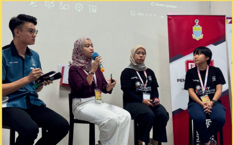
Sekitar hari kedua, Youth & Nation Forum bertemakan "The Role of Youth in National Development and the SDGs bersama para panel.

Program Y-Lead: Youth in Leadership 2025 telah berjaya dianjurkan selama dua hari yang penuh inspirasi dan pengisian bermakna, bertujuan memperkasa ahli Sidang Muda Pulau Pinang 2025 sebagai pemimpin belia dan ejen perubahan masa hadapan. Program ini dirangka secara komprehensif untuk membina asas kepimpinan yang kukuh, berteraskan nilai integriti, kredibiliti serta keupayaan berfikir secara kritis dan strategik. Sepanjang dua hari pelaksanaan, para peserta didedahkan kepada pelbagai modul latihan kepimpinan yang merangkumi pembangunan sendiri, kemahiran komunikasi, kolaborasi berpasukan serta kefahaman mendalam terhadap peranan belia dalam pembangunan negara dan agenda global seperti Matlamat Pembangunan Mampan (SDGs).