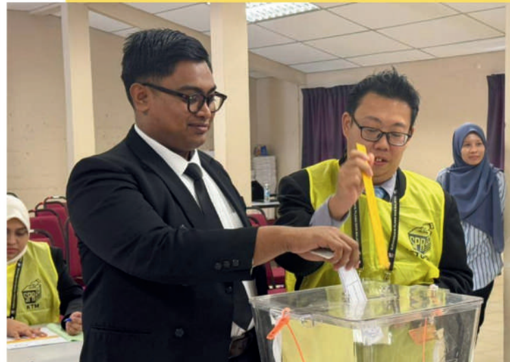
Ahli Sidang Muda 2025 sedang mengundi bagi memilih Barisan EXCO melalui pilihan raya pemilihan yang dikendalikan oleh Pejabat Pilihan Raya Pulau Pinang (SPR).

Di samping itu, Taklimat Pendidikan dan Simulasi Pengundian yang dikendalikan oleh Pejabat Pilihan Raya Negeri Pulau Pinang telah memberi pendedahan mendalam mengenai proses pilihan raya yang telus dan adil, termasuk peranan pengundi, kaedah pengundian serta kepentingan integriti dalam sistem demokrasi. Kemuncak bengkel ini ialah Pilihan Raya Pemilihan EXCO Sidang Muda Pulau Pinang 2025, di mana seramai 40 orang Ahli Sidang Muda telah melalui proses pengundian bagi memilih barisan kepimpinan, termasuk jawatan.