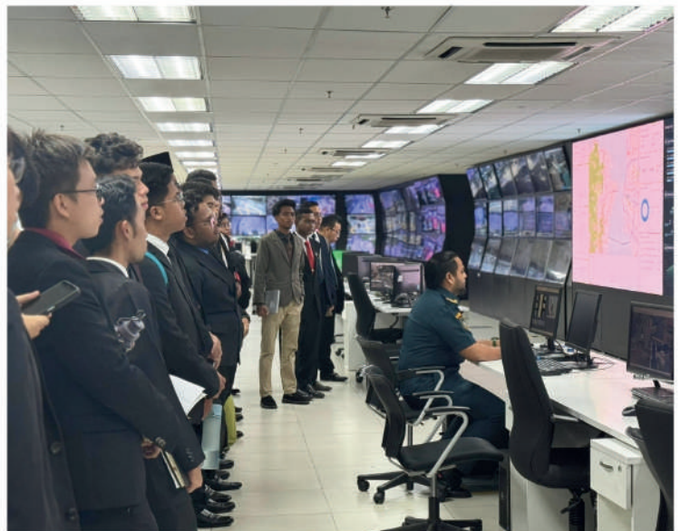
Ahli Sidang Muda 2025 berkesempatan melawat Intelligence Operations Centre (IOC) MBPP.