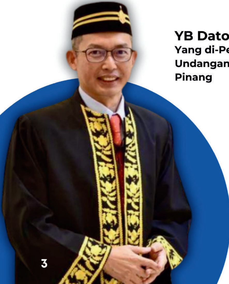
YB Dato' Seri Law Choo Kiang Yang di-Pertua Dewan Undangan Negeri Pulau Pinang

Golongan belia merupakan pelapis kepimpinan masa hadapan yang akan mencorakkan hala tuju negeri dan negara. Dalam landskap politik dan sosial yang semakin dinamik, keterlibatan belia dalam proses demokrasi perlu diperkasa melalui pendedahan awal, pendidikan sivik dan platform yang memberi ruang kepada suara serta pandangan mereka. Sidang Muda Pulau Pinang berperanan sebagai medan latihan yang signifikan untuk membentuk kefahaman tentang proses persidangan, perbahasan, penggubalan resolusi serta etika dan tatacara Dewan Undangan Negeri.